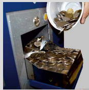
Münzen als Schüttgut